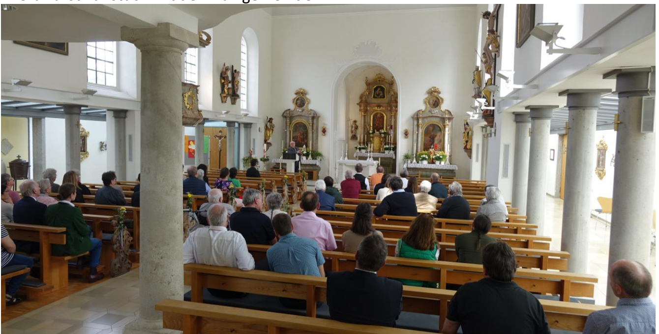
Kirchenführung für Interessierte