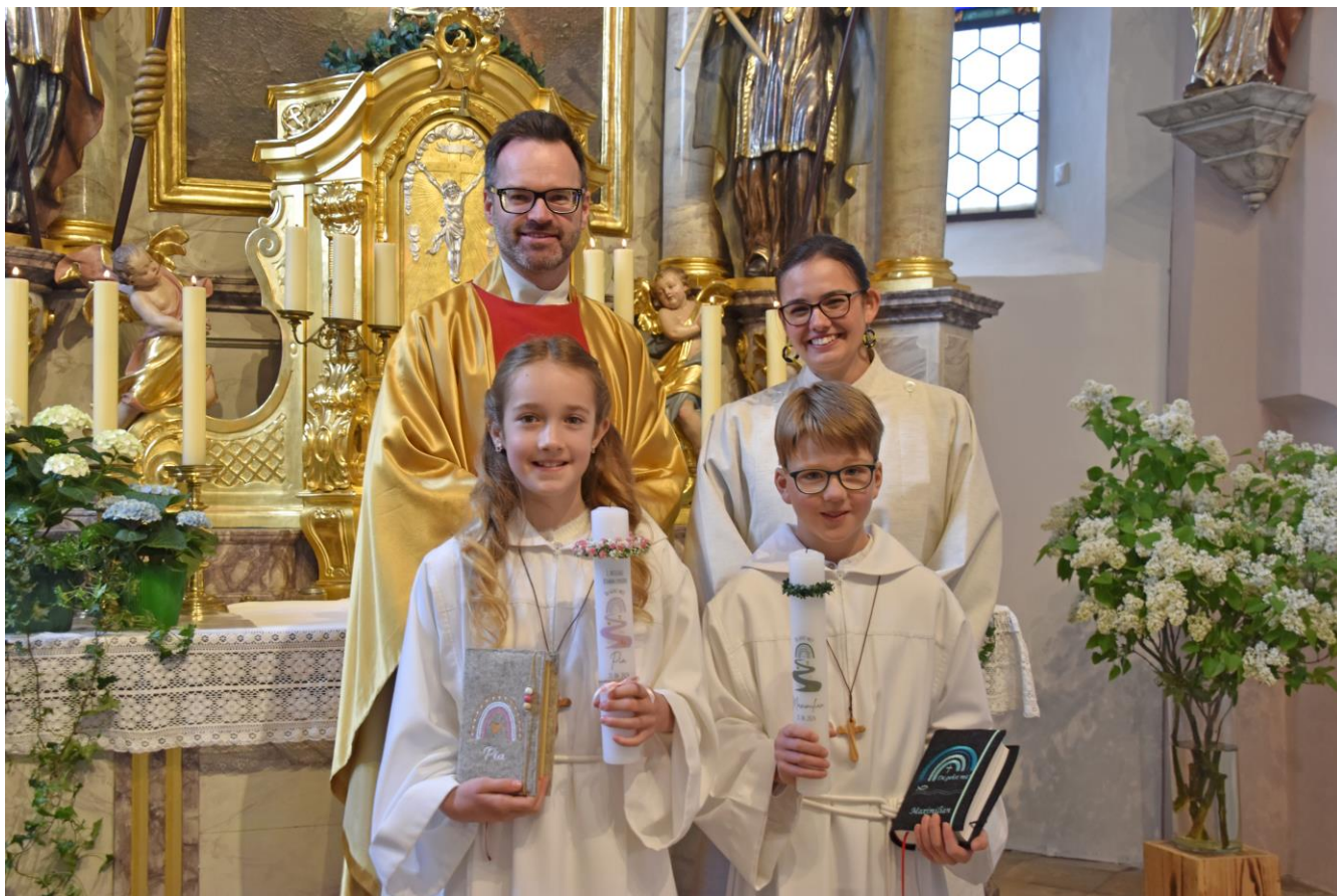
Erstkommunion in Niederumelsdorf am 21. April 2024

Mesnerin unserer Pfarrkirche St. Michael in Train feierte Doppeljubiläum: 75. Geburtstag und 25 Jahre Mesnerin