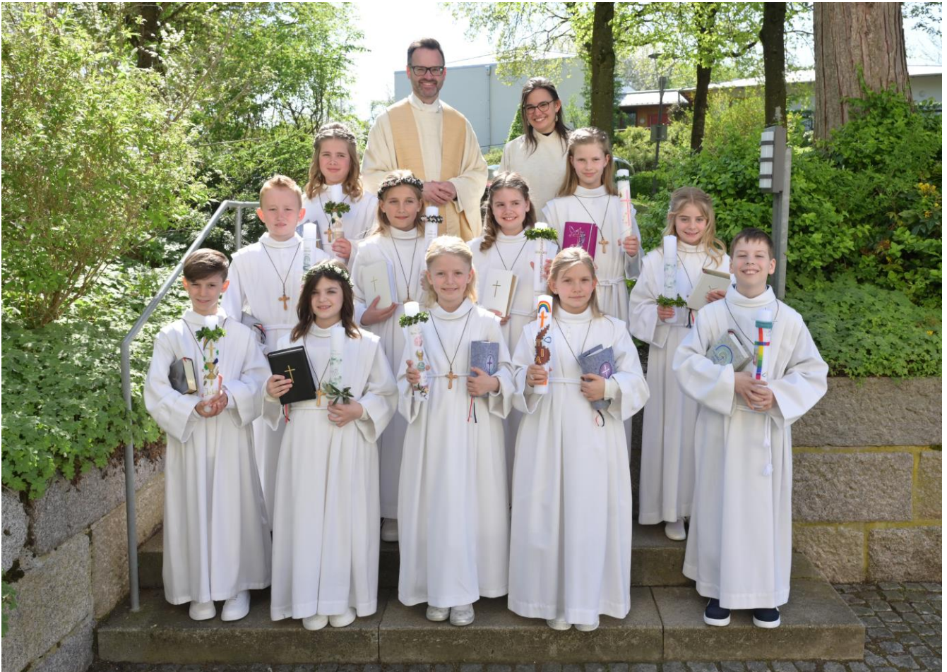
Erstkommunion in Train am 13. April 2024