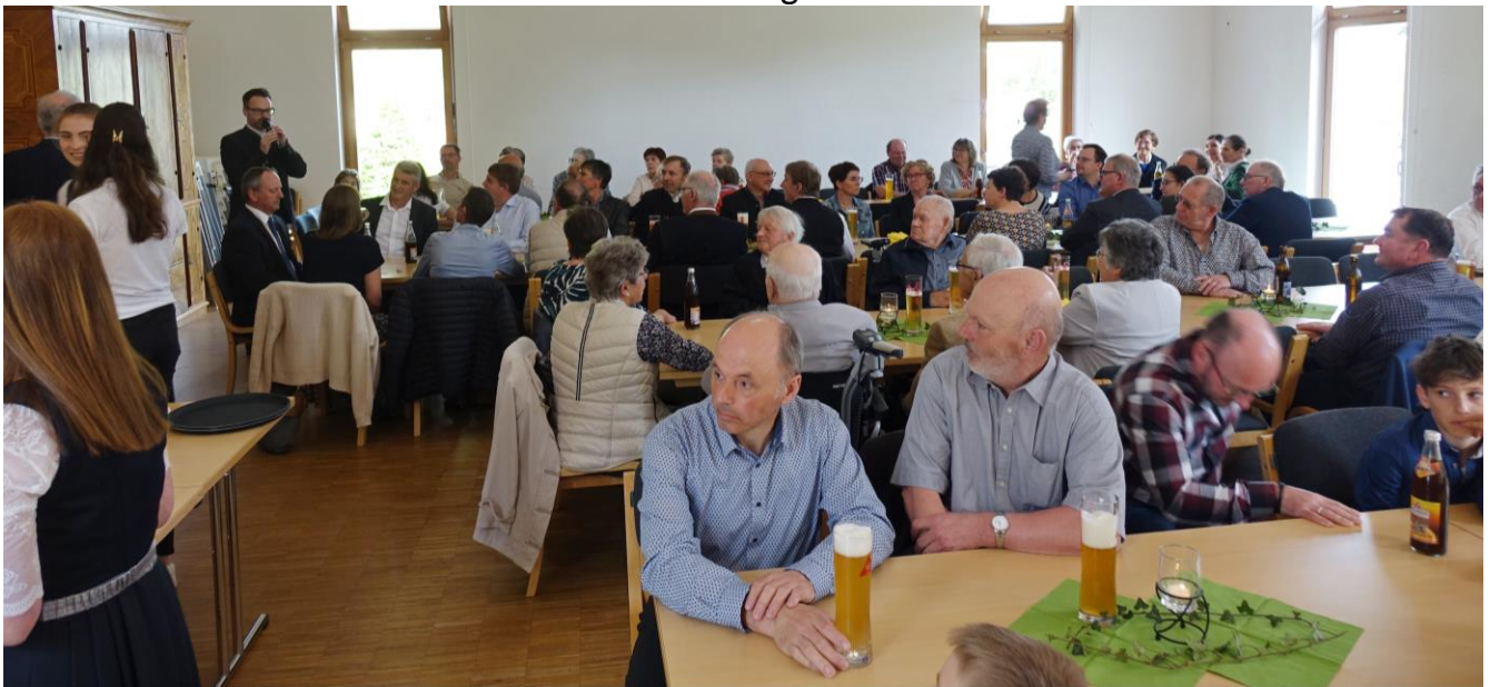
Weißwurstfrühstück mit der Pfarrgemeinde