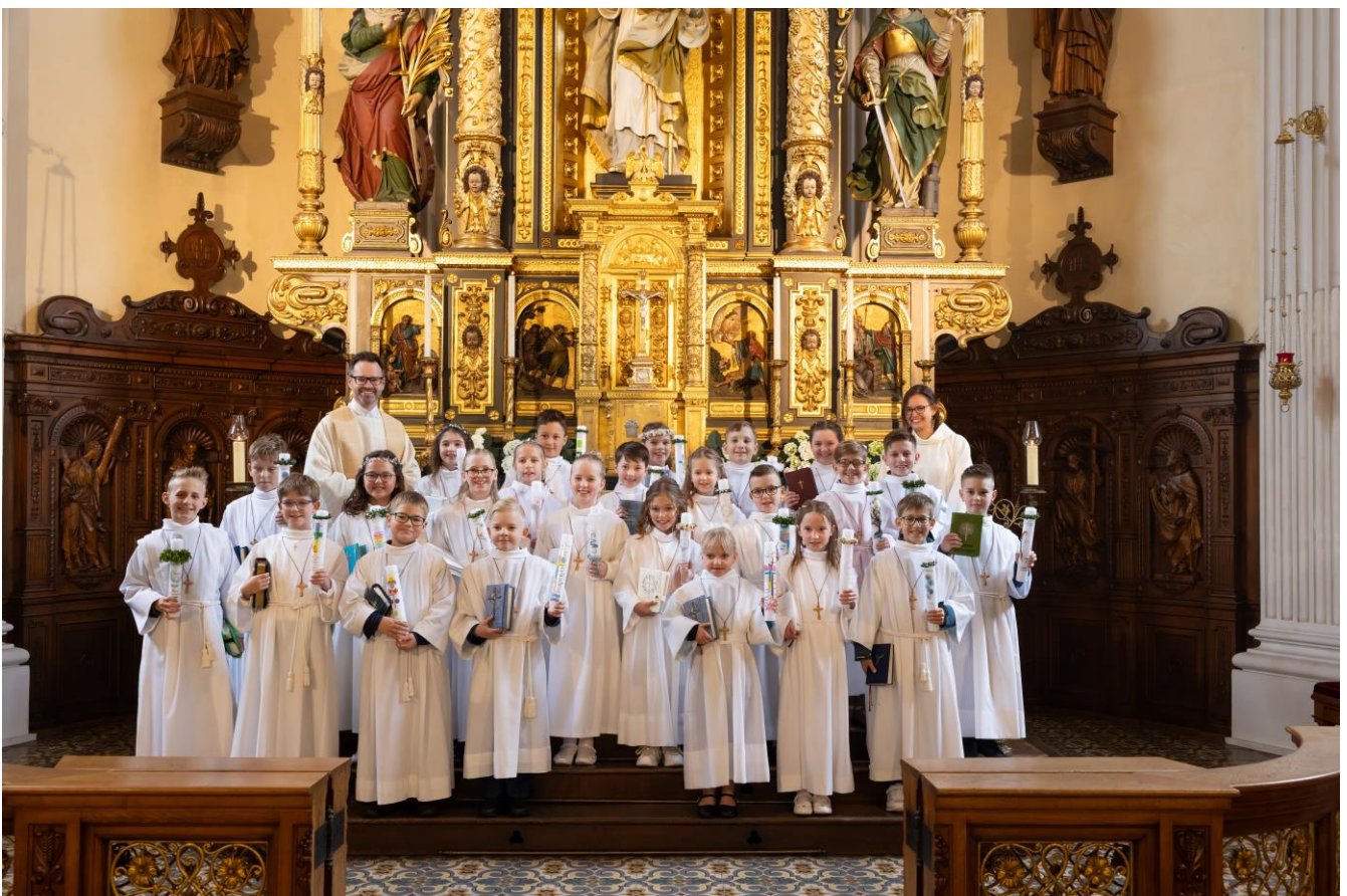
Erstkommunion in Siegenburg am 20. April 2024